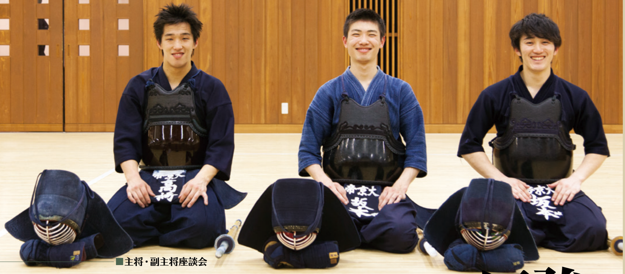
主将・副主将座談会